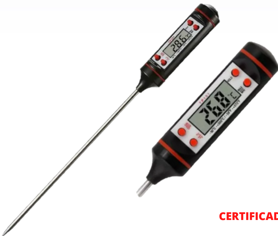
Termômetro Digital LCD Espeto

CERTIFICADO DE CALIBRAÇÃO RASTREADO INCLUSO