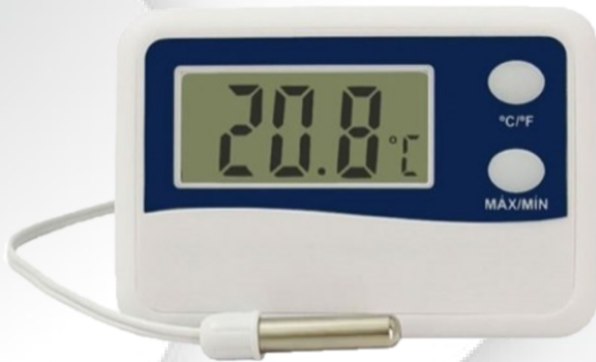
Termômetro Digital LCD Máx. Mín. - Incoterme