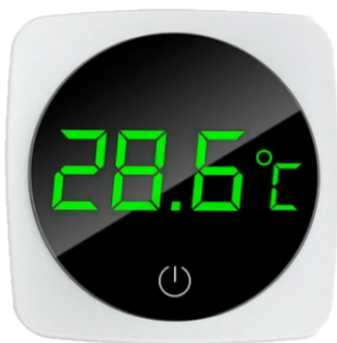
Termômetro Digital LCD Aquário

Tamanho : 67x43x25 mm Temperatura -20 °C a 60 °C Alimentação 1 bateria CR2032