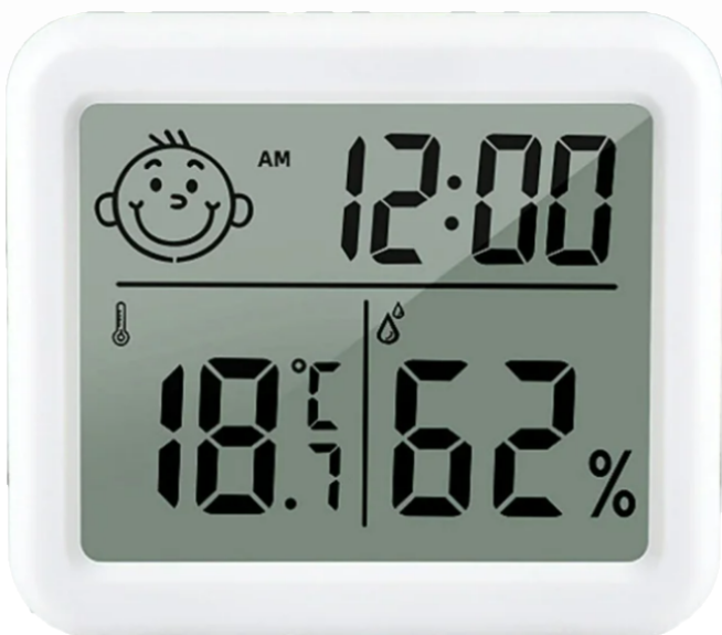
Termo-Higrômetro Digital LDC Relógio

Medidas: 43x23x11 mm Temperatura -50 °C a 70 °C Alimentação 1 Baterias Cr2032 Sem Cabo