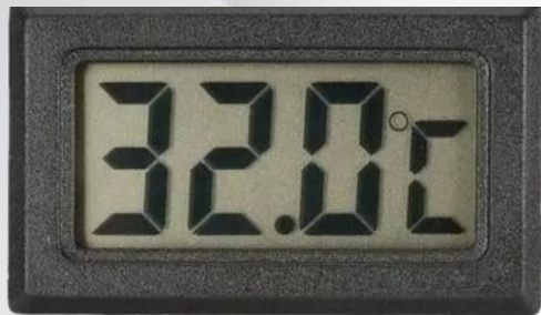
Termômetro Digital LCD Freezer - Preto