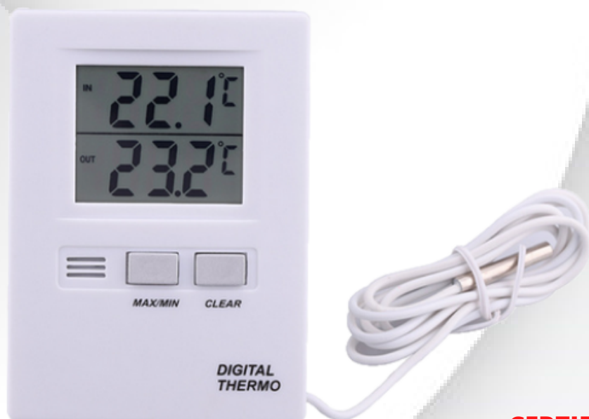
Termômetro Digital LCD Clear cabo 1,0 metro