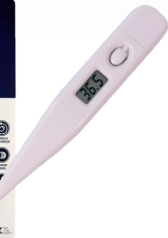
Termômetro Clínico com Alarme - Febre