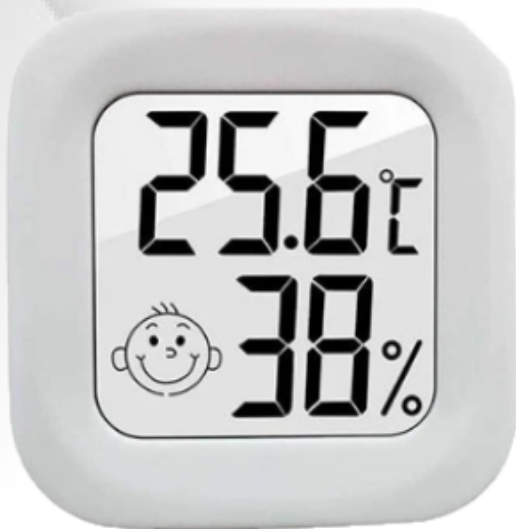
Termo-Higrômetro Digital LDC Mini