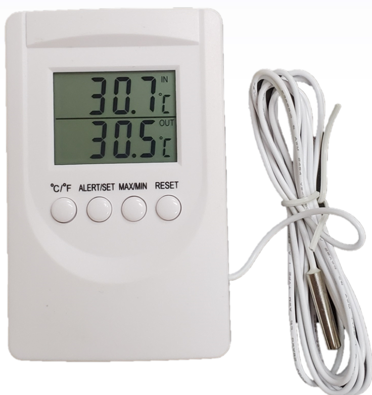
Termômetro Digital LCD Alarme cabo 1,8 metro

Medidas : 85x62x19 mm Cabo 1 metro Temperatura indoor -10 °C a 70 °C Temperatura outdoor -50 °C a 70 °C Alimentação 1 Pilha AAA Memória Máximo e Mínimo