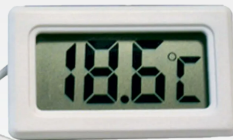
Termômetro Digital LCD Freezer - Branco

Medidas : 47x28x14 mm Cabo 1 metro Temperatura -50 °C a 110 °C Precisão +- 1 °C Alimentação 2 baterias LR44