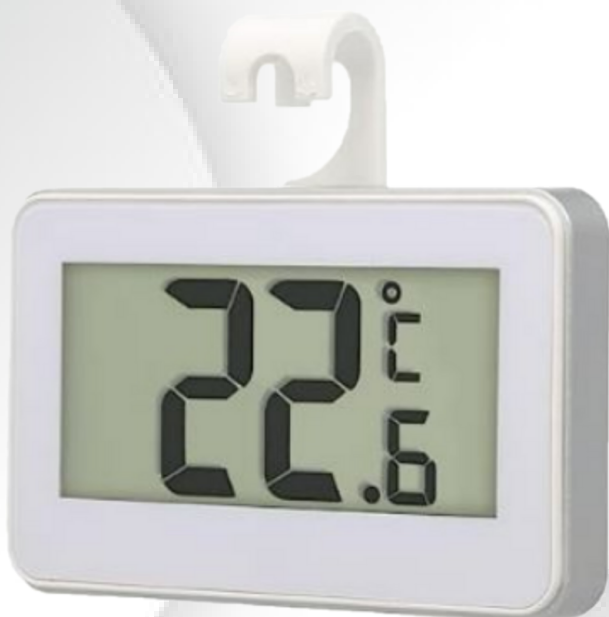
Termômetro Digital LCD Geladeira